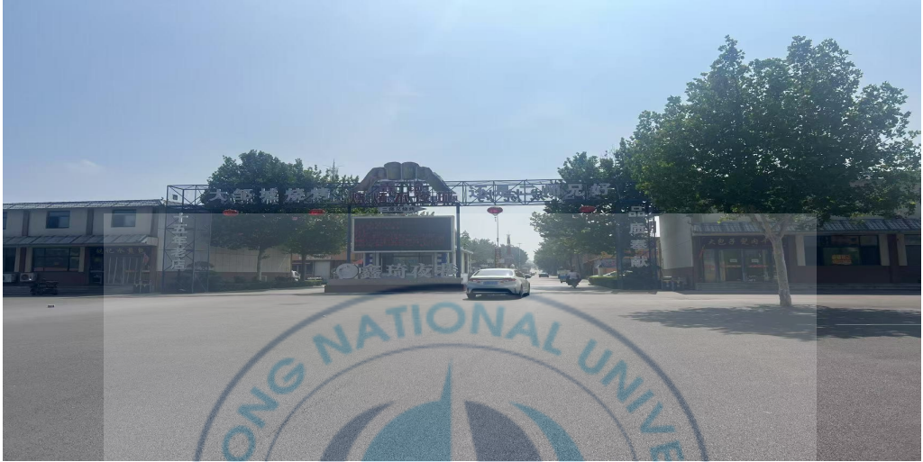
<图 2-10>鑫琦烧烤城 18

在夜间经济成功实践的基础上，后八里沟村进一步拓展“以城带乡”发展模式，主动发挥毗邻城区的区位优势，构建多元化、复合型的专业市场体系，以承接城市外溢业态、激活地方产业生态。该战略不仅有效拓展了村集体的经济边界，也体现了其在复杂政策环境中对结构性机会的敏锐识别能力。村集体在空间资源紧张背景下，统筹调配出 100 余亩优质建设用地，规划并建设了涵盖文化餐饮、特色宠物观赏、汽车服务等领域的四大主题街区，包括“文化餐饮一条街”“花鸟鱼虫市场”“汽车美容服务区”以及附属经营性门店等。这一系列项目形成了相互支撑的业态集群，吸引了 500 余户具有技能专长的个体经营者入驻，基本实现了“城市边缘—功能疏解—乡村承接”的结构性转移。