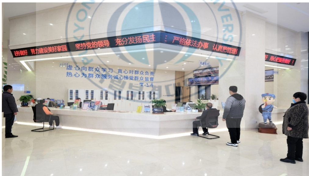
<图 2-3>后八里沟村为民服务大厅 10

因此，后八里沟村所展现出的，是一种将个人领导力与组织制度建设相结合的乡村治理样态。在该模式下，个人威望不再是治理的唯一支撑，而成为制度运行的助推器。制度权威与个人权威之间并非此消彼长，而是通过制度性配置形成互促关系，从而为村庄发展提供了兼具稳定性与变革性的治理结构基础。这一良性互动机制，不仅提升了基层组织的政治整合力，也为未来“新乡贤”型领导模式的推广提供了可借鉴的实践范式。