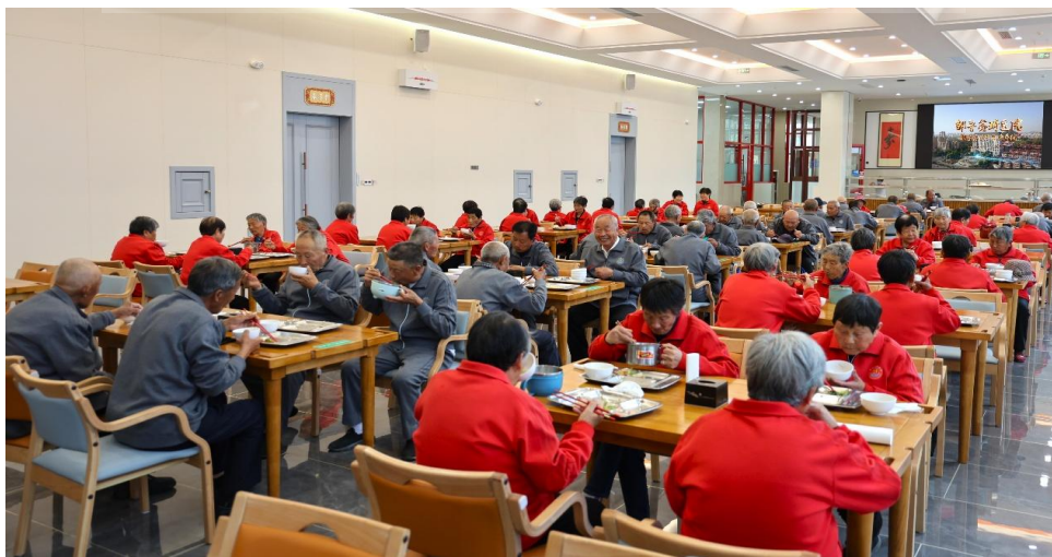
<图 2-12>村中老人免费聚餐 20

后八里沟村通过建立制度化的孝老保障体系、重构邻里互助网络以及实施福利性再分配机制，逐步形成了以互助为核心的社区支持结构。这一互助体系不仅提高了村庄应对社会风险的能力，也体现了传统价值在现代社区治理中的转化与实践，构成其社会韧性的重要组成部分。