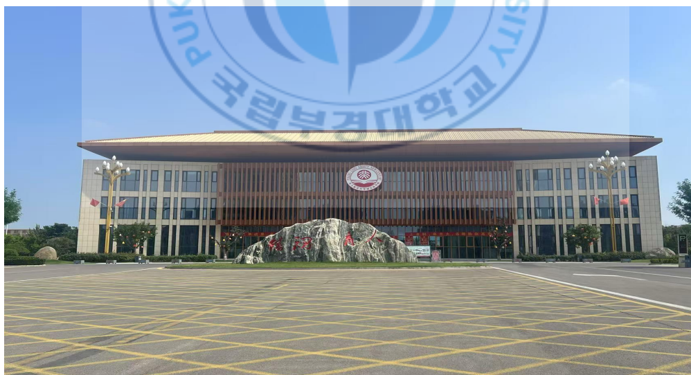
<图 2-8>北大新世纪学校 16

在医疗和养老产业方面，后八里沟村同样投入巨资进行布局。继村办学校之后，村集体于 2021 年建成了一座投资 3.3 亿元的中医医养康复中心，提供医疗保健和高端养老服务。这些教育、医疗、养老领域的前瞻性