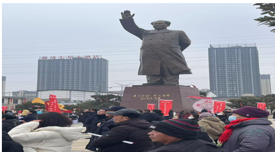
<图 2-5>毛泽东铜像 12

整体来看，后八里沟村的红色文化实践展现了生态建设与文化赋能融合的复合性路径。这种模式不仅提升了社区的精神生态环境，也拓展了乡村可持续发展的内在动能，契合“绿水青山就是金山银山”理念所倡导的“生态—文化”协同逻辑。红色文化的空间化与制度化，为乡村治理提供了稳定的价值支撑，也为生态韧性的持续提升营造了良好的社会基础。