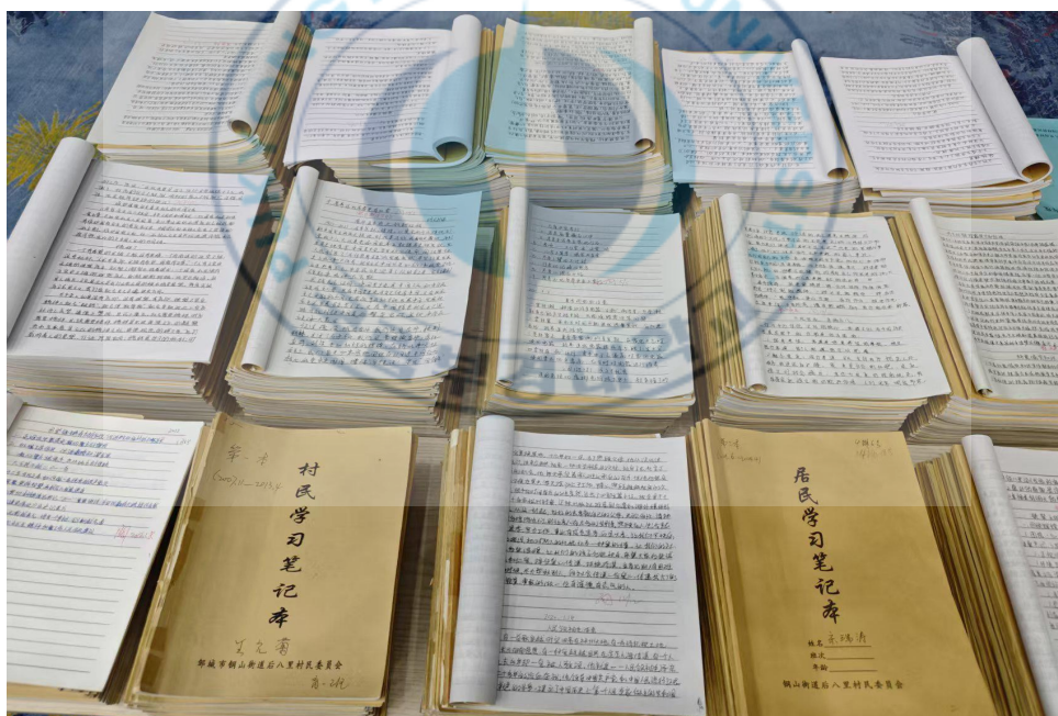
<图 2-11>村民夜校学习笔记 19