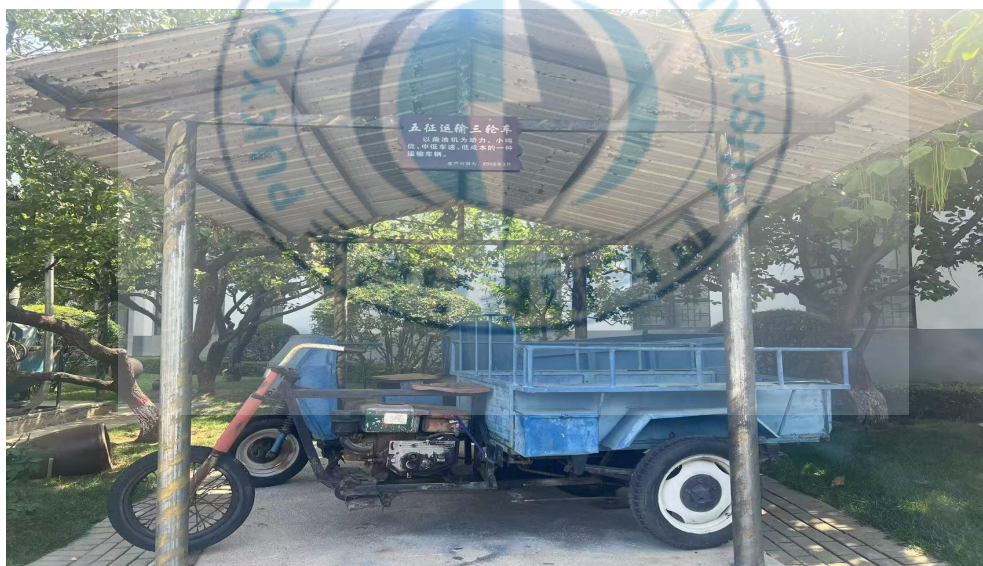
<图 2-7>农业展示馆 14

目前，农业在后八里沟村的功能已从传统的经济支柱转化为文化象征与身份标识。其所承载的历史记忆、生活方式与文化价值成为村庄在城市化进程中维护社区连续性与文化主体性的关键支撑。通过对农业文化的保留与创新传承，后八里沟村在推进现代化的同时实现了与传统社会文化的有机衔接。