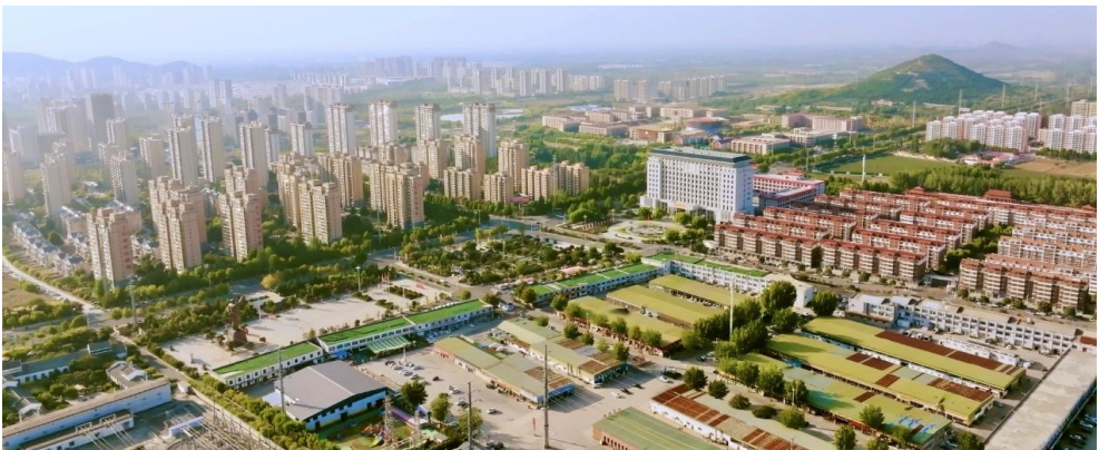
<图 2-1> 后八里沟村鸟瞰图 6

本研究将视野聚焦于鲁南地区，尤其是山东省邹城市的后八里沟村，主要基于以下几点研究考量：一方面，山东作为儒家文化的重要发源地，其所蕴含的传统价值体系在乡村治理结构与社会互动机制中依然发挥着深远影响。邹城市作为儒家文化代表人物之一的孟子故里，文化遗产深厚。“孝悌仁义”等价值观在村庄公共事务、家庭结构与社会规范中的存续为研究“文化韧性”提供了实践土壤。另一方面，邹城市近年来经济结构调整显著，煤炭资源型经济向装备制造业转型过程中，城乡联系日益紧密，形成了典型的“城乡交错带”，这一区域既承载着传统农业形态，也接受着现代城镇功能的渗透。